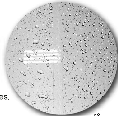
Angle de contact 105°