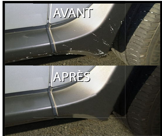
n° 715-01 4 X 3.78lt Caisse